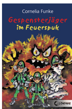
Gespensterjäger im Feuerspuk