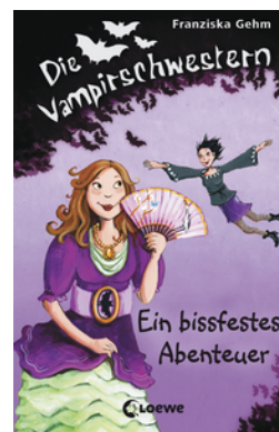
Die Vampirschwestern (Band 2) - Ein bissfestes Abenteuer