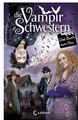
Die Vampirschwestern – Das Buch zum Film