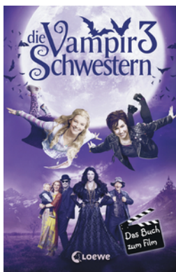
Die Vampirschwestern 3 – Das Buch zum Film