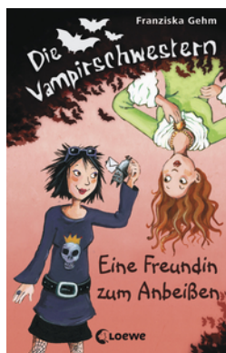
Die Vampirschwestern (Band 1) - Eine Freundin zum Anbeißen