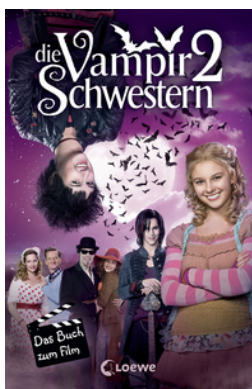
Die Vampirschwestern 2 – Das Buch zum Film