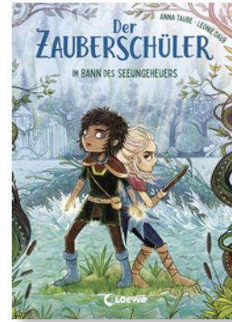
Der Zauberschüler (Band 2) - Im Bann des Seeungeheuers