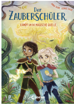
Der Zauberschüler (Band 4) - Kampf um die Magische Quelle