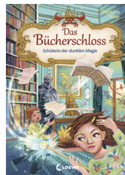
Das Bücherschloss (Band 6) - Schülerin der dunklen Magie