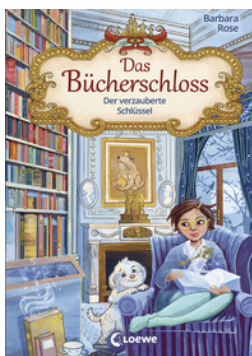
Das Bücherschloss (Band 2) - Der verzauberte Schlüssel