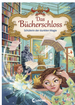
Das Bücherschloss (Band 6) - Schülerin der dunklen Magie