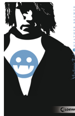
Vladimir Tod beisst sich durch (Band 2)