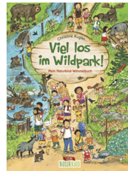
Viel los im Wildpark!