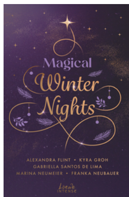
Magical Winter Nights