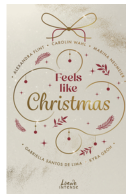
Feels like Christmas