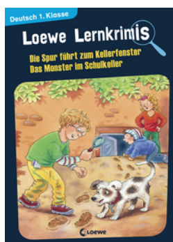
Loewe Lernkrimis - Die Spur führt zum Kellerfenster / Das Monster im Schulkeller