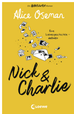
Nick & Charlie (deutsche Ausgabe)