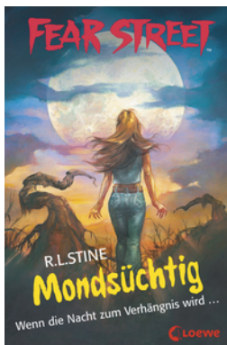
Fear Street 57 - Mondsüchtig