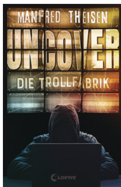
Uncover - Die Trollfabrik