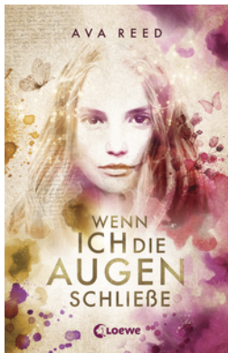
Wenn ich die Augen schließe