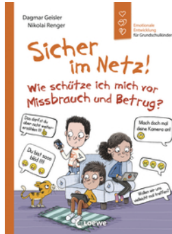
Sicher im Netz! Wie schütze ich mich vor Missbrauch und Betrug? (Starke Kinder, glückliche Eltern)