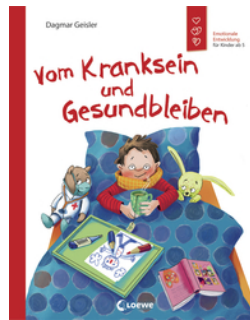
Vom Kranksein und Gesundbleiben (Starke Kinder, glückliche Eltern)