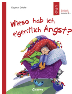
Wieso hab ich eigentlich Angst? (Starke Kinder, glückliche Eltern)