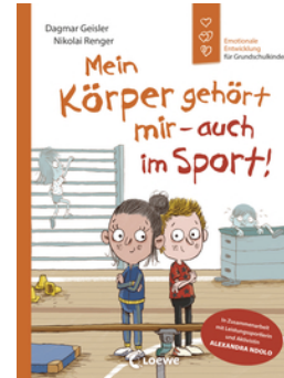
Mein Körper gehört mir - auch im Sport! (Starke Kinder, glückliche Eltern)