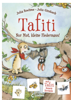
Tafiti - Nur Mut, kleine Fledermaus!