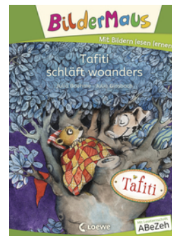
Bildermaus - Tafiti schläft woanders