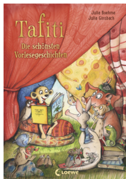
Tafiti - Die schönsten Vorlesegeschichten