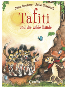
Tafiti und die wilde Bande (Band 20)