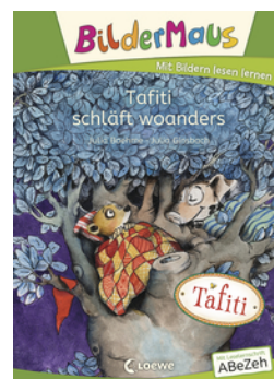
Bildermaus - Tafiti schläft woanders