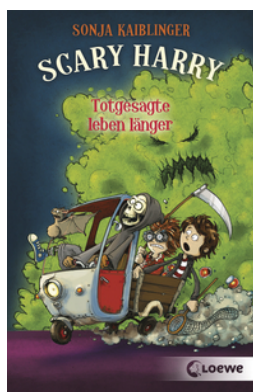
Scary Harry (Band 2) - Totgesagte leben länger