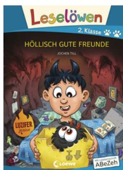
Leselöwen 2. Klasse - Höllisch gute Freunde (Großbuchstabenausgabe)