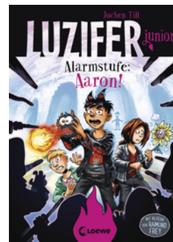
Luzifer junior (Band 16) - Alarmstufe: Aaron!