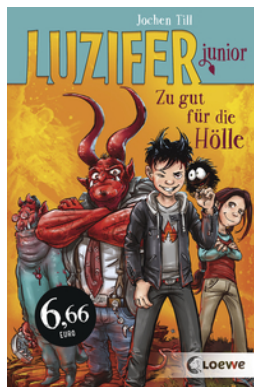
Luzifer junior (Band 1) - Zu gut für die Hölle