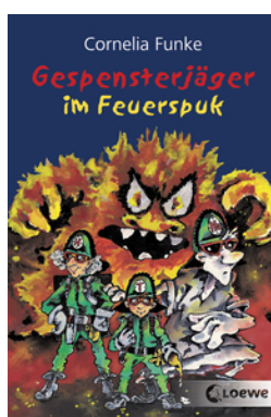
Gespenssterjäger im Feuerspuk