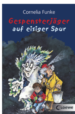
Gespenssterjäger auf eisiger Spur