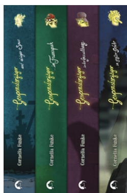
Gespenssterjäger - Die komplette Reihe