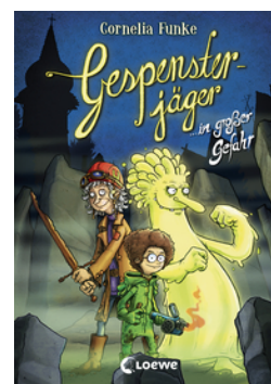
Gespenssterjäger in großer Gefahr