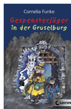
Gespenssterjäger in der Gruselburg