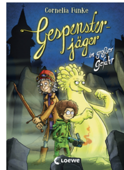
Gespensterjäger in großer Gefahr