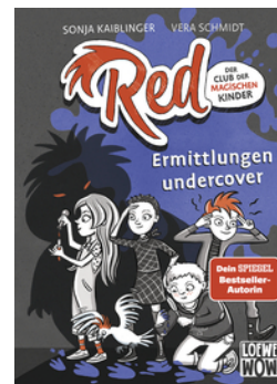
Red - Der Club der magischen Kinder (Band 2) - Ermittlungen undercover