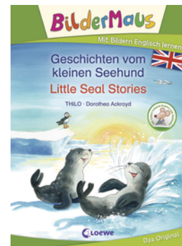
Bildermaus - Mit Bildern Englisch lernen - Geschichten vom kleinen Seehund - Little Seal Stories