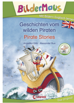
Bildermaus - Mit Bildern Englisch lernen - Geschichten vom wilden Piraten - Pirate Stories