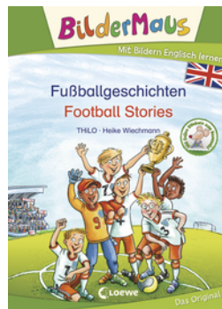
Bildermaus - Mit Bildern Englisch lernen - Fußballgeschichten - Football Stories