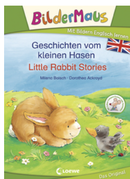
Bildermaus - Mit Bildern Englisch lernen - Geschichten vom kleinen Hasen - Little Rabbit Stories