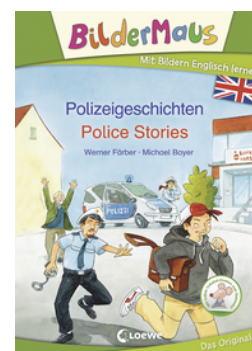
Bildermaus - Mit Bildern Englisch lernen - Polizeigeschichten - Police Stories