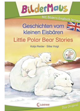
Bildermaus - Mit Bildern Englisch lernen - Geschichten vom kleinen Eisbären - Little Polar Bear Stories