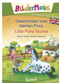
Bildermaus - Mit Bildern Englisch lernen - Geschichten vom kleinen Pony - Little Pony Stories