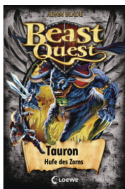
Beast Quest (Band 66) - Tauron, Hufe des Zorns