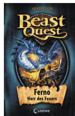
Beast Quest (Band 1) - Ferno, Herr des Feuers