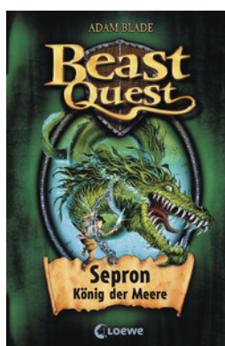
Beast Quest (Band 2) - Sepron, König der Meere