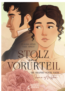
Stolz und Vorurteil - Die Graphic Novel nach Jane Austen