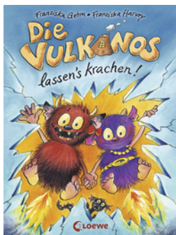
Die Vulkanos lassen's krachen! (Band 3)