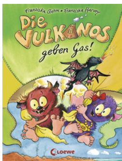
Die Vulkanos geben Gas! (Band 5)