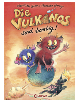
Die Vulkanos sind bombig! (Band 2)