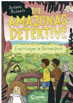
Die Amazonas-Detektive (Band 4) - Ermittlungen im Nationalpark