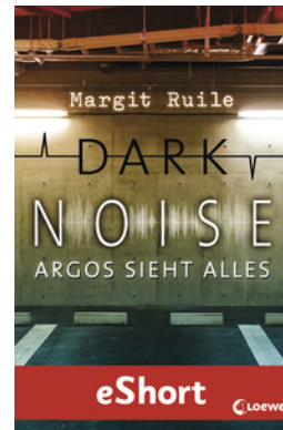
Dark Noise - Argos sieht alles