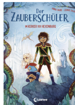
Der Zauberschüler (Band 5) - Im Kerker der Hexenburg