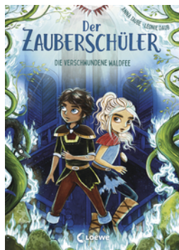
Der Zauberschüler (Band 7) - Die verschwundene Waldfee