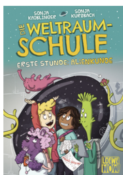
Die Weltraumschule (Band 1) - Erste Stunde: Alienkunde