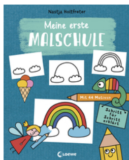
Meine erste Malschule