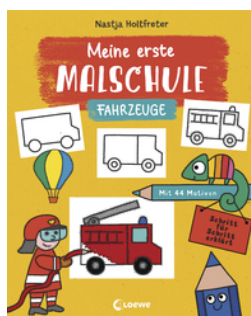
Meine erste Malschule - Fahrzeuge