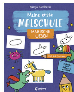
Meine erste Malschule - Magische Wesen