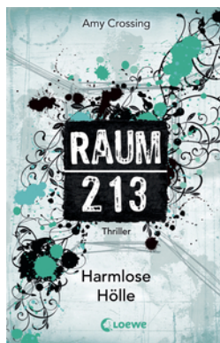
Raum 213 (Band 1) – Harmlose Hölle