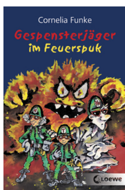
Gespensterjäger im Feuerspuk