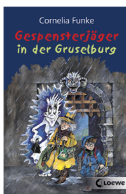
Gespensterjäger in der Gruselburg