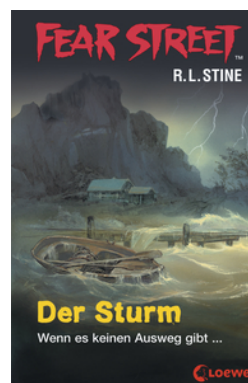
Fear Street 55 - Der Sturm