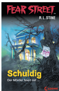
Fear Street 51 - Schuldig