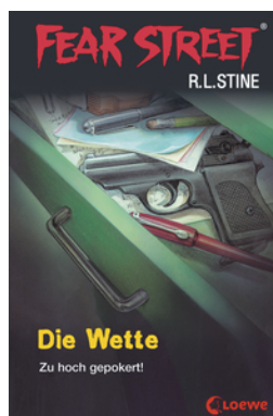
Fear Street 56 - Die Wette