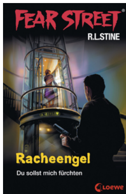
Fear Street 60 - Racheengel