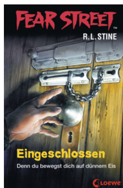
Fear Street 53 - Eingeschlossen