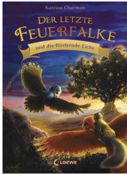
Der letzte Feuerfalte und die flüsternde Eiche (Band 3)