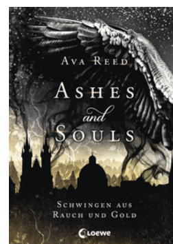
Ashes and Souls (Band 1) - Schwingen aus Rauch und Gold