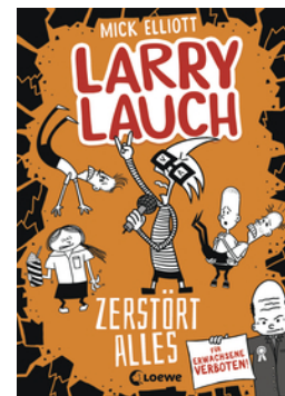
Larry Lauch zerstört alles (Band 3)