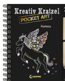
Kreativ-Kratzel Pocket Art: Fantasy