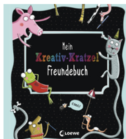
Mein Kreativ-Kratzel Freundebuch