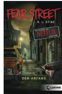
Fear Street - Der Anfang