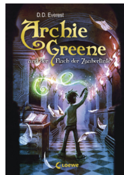
Archie Greene und der Fluch der Zaubertinte (Band 2)