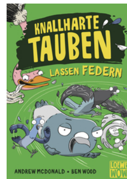
Knallharte Tauben lassen Federn (Band 2)