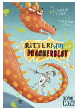
Rittermut und Drachenblut