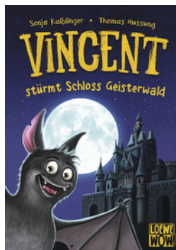
Vincent stürmt Schloss Geisterwald (Band 4)