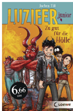
Luzifer junior (Band 1) - Zu gut für die Hölle