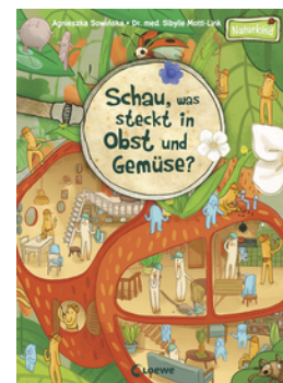
Schau, was steckt in Obst und Gemüse?