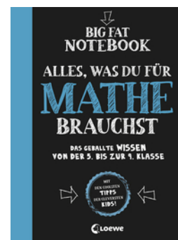
Big Fat Notebook - Alles, was du für Mathe brauchst - Das geballte Wissen von der 5. bis zur 9. Klasse