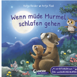
Wenn müde Marmel schlafen gehen