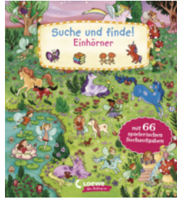
Suche und finde! Einhörner