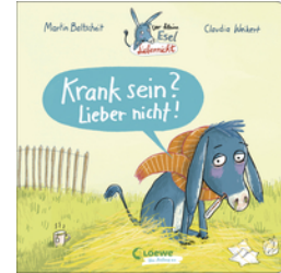
Der kleine Esel Lieber nicht - Krank sein? Lieber nicht!