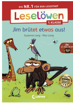
Leselöwen 1. Klasse - Jim ist mies drauf - Jim brütet etwas aus!