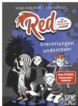
Red - Der Club der magischen Kinder (Band 2) - Ermittlungen undercover