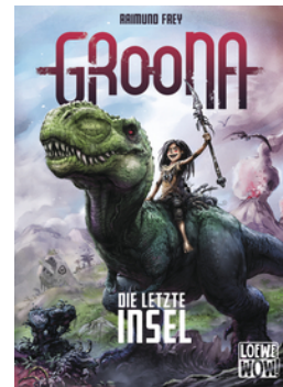
Groona - Die letzte Insel