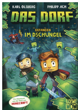
Das Dorf (Band 3) - Gefangen im Dschungel