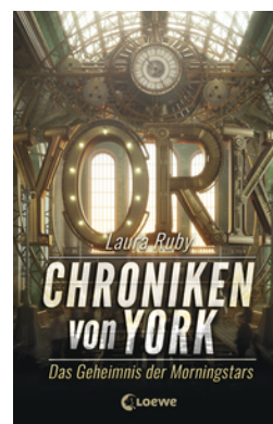
Chroniken von York (Band 2) - Das Geheimnis der Morningstars