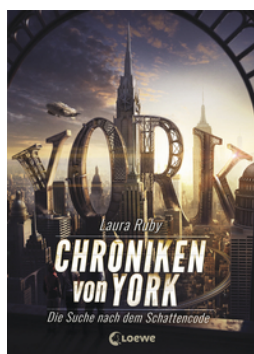
Chroniken von York (Band 1) - Die Suche nach dem Schattencode