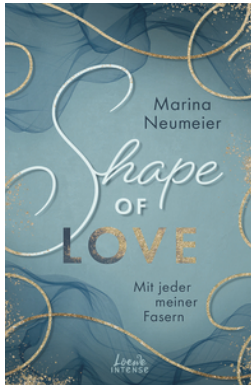
Shape of Love - Mit jeder meiner Fasern (Love-Trilogie, Band 1)