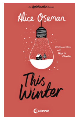
This Winter (deutsche Ausgabe)