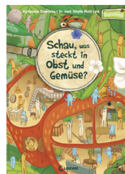
Schau, was steckt in Obst und Gemüse?