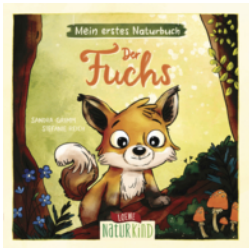
Mein erstes Naturbuch - Der Fuchs