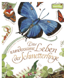
Das wundersame Leben der Schmetterlinge