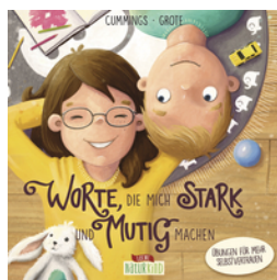
Worte, die mich stark und mutig machen