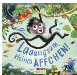
Laaangsam, kleines Äffchen!