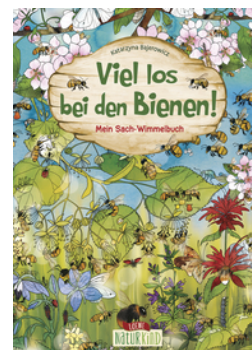
Viel los bei den Bienen!