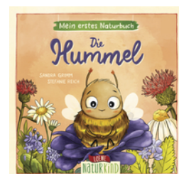
Mein erstes Naturbuch - Die Hummel