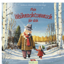
Mein Weihnachtswunsch für dich